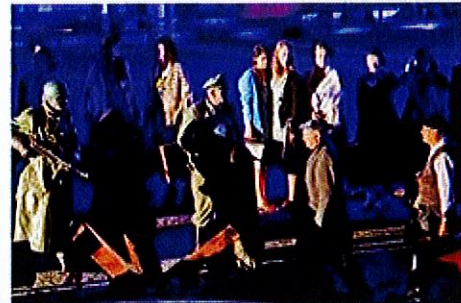
Deux cent cinquante comédiens amateurs étaient sur scène.

Caudry continue, aujourd'hui, de célébrer les 80 ans de sa libération : à 9 h, le « convoi de la liberté » partira de poëlis des sports pour traverser la ville et des communes alentour avec un retour prévu place De Gaulle vers 12 h 30 ; le soir, à 19 h, le bal de la libération à la base de loisirs (gratuit et ouvert à tout âge) le camp allié restera accessible de 9 h à 19 h.