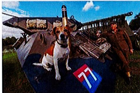
De nombreux stands et objets d'époque attendent les visiteurs.