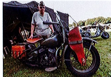
L'association franco-belge MVGG Hainaut expose aussi ses véhicules.